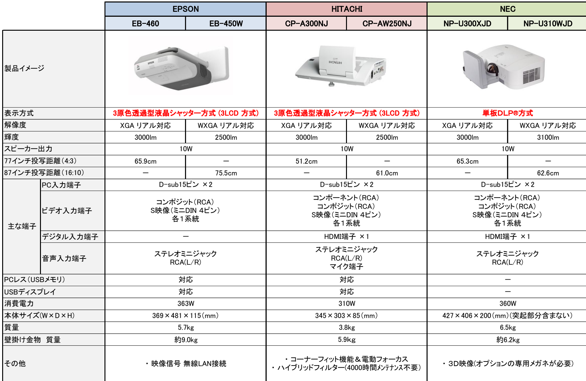
プロジェクター比較表